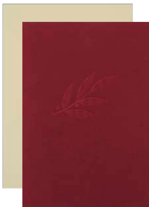
21x30 cm Art-Nr. UM1-C od. UM1-W 24x32 cm Art-Nr. UM2-C od. UM2-W 30x42 cm Art-Nr. UM3-C od. UM3-W

Die preislich günstigen Urkundenmappen aus ledergenarbttem Karton weisen als erhaben geprägtes Blattmotiv einen stilisierten Lorbeerzweig auf. Eine kleine Plastikflasche in der Innenseite verhindert ein Herausrutschen der Urkunde. Für herausragende Ehrungen stehen verschiedene Mappen aus wattiertem Skivertex, in Leinenstruktur oder aus echtem Leder zur Verfügung. Die Dokumente lassen sich zusätzlich durch Zellophanhüllen (ohne Abb.) schützen.