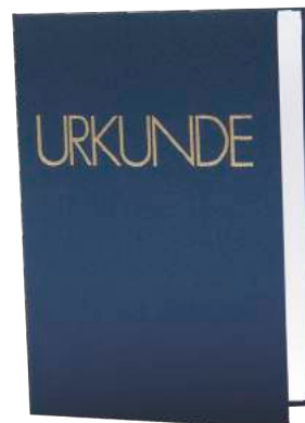
21x30 cm Art-Nr. LEI1 24x32 cm Art-Nr. LEI2 30x42 cm Art-Nr. LEI3