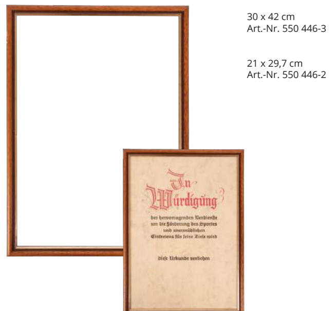
30 x 42 cm Art.-Nr. 550 446-3