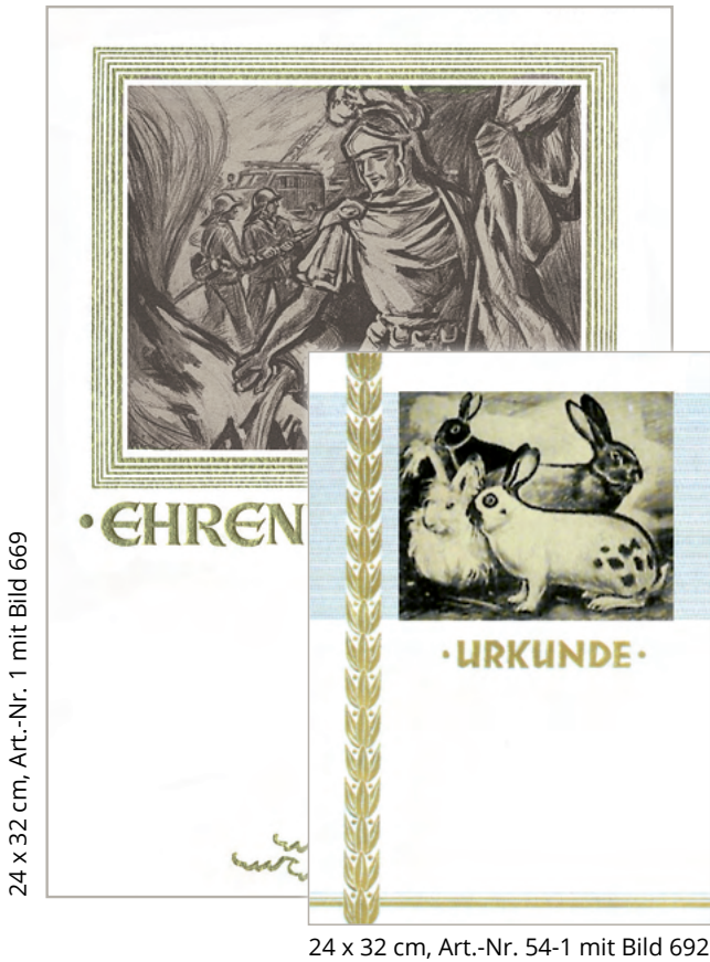
24 x 32 cm, Art.-Nr. 1 mit Bild 669

Für Freunde von altertümlich wirkenden Urkunden haben wir diese Retro-Bilder im Programm. Sie können auf Urkunden und Ehrenurkunden in den Formaten DIN A4 oder 24 x 32 cm aufgeklebt werden. Der weiße Karton wirkt sehr edel. Die Bilder dürfen erst nach dem Beschriften durch den PC aufgeklebt werden.