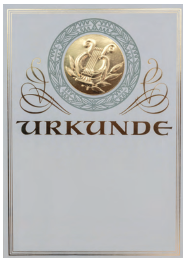
Art.-Nr. 56-1-PC mit Bild 618

Bei diesen Urkunden ist das Motiv in den Karton flach geprägt. Die Figuren und Embleme sind in Gold angelegt. Alle von uns angebotenen Urkunden lassen sich mit einem haushaltsüblichen Drucker beschriften. Sie sind in DIN A4, also 21 x 29,7 cm groß. Die 7 cm großen runden Embleme sind von einem hellgrauen, stilisierten Eichenlaub-/Lorbeerkranz eingeraht. Rechts und links davon finden sich goldene Ornamentschnörkel. Auch das Wort URKUNDE ist in gold aufgedruckt. Dieses sehr edle Dokument besticht durch seine Schlichtheit. Die untere Hälfte des 200 g/m 2 schweren Kartons lässt Platz für längere Beschriftungen, den Namen des zu Ehrenden und Unterschriftzeilen, je nach Ihren Anforderungen.