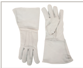
Lederhandschuhe mit Stulpen, Rind Art.-Nr. 350 402