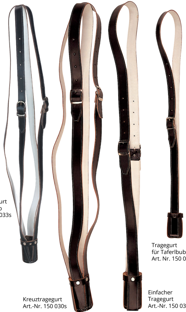
Kreuztragegurt für Taferlbub Art.-Nr. 150 033s