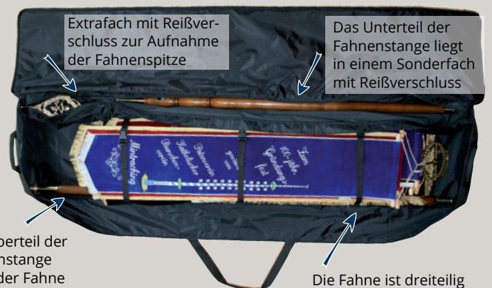
Extrafach mit Reißverschluss zur Aufnahme der Fahnenstange