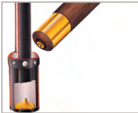
Querschnitt eines Köchers mit Drehvorrichtung zum leichten Schwingen der Fahnen Art.-Nr. 150 260

Zu einer wertvollen Fahne gehört natürlich das entsprechende Zubehör. Hier bewähren sich die guten Detaillösungen aus unserem Hause: z.B. bei einem von uns entwickelten System zum leichten Schwingen der Fahne im Tragegurt (s. Abb.) oder bei den Stangen und Verschraubungen, die sich gleichermaßen als praxistauglich und stabil erweisen.