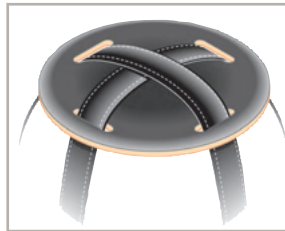
Rückenteil gegen das Verrutschen des Kreuztragegurtes Art.-Nr. 150 036