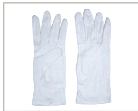
Trikot-Handschuhe Weißer Stoff, kurz Art.-Nr. 350 401