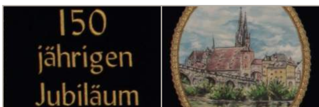
Computerbeschriftung (siehe S. 46)