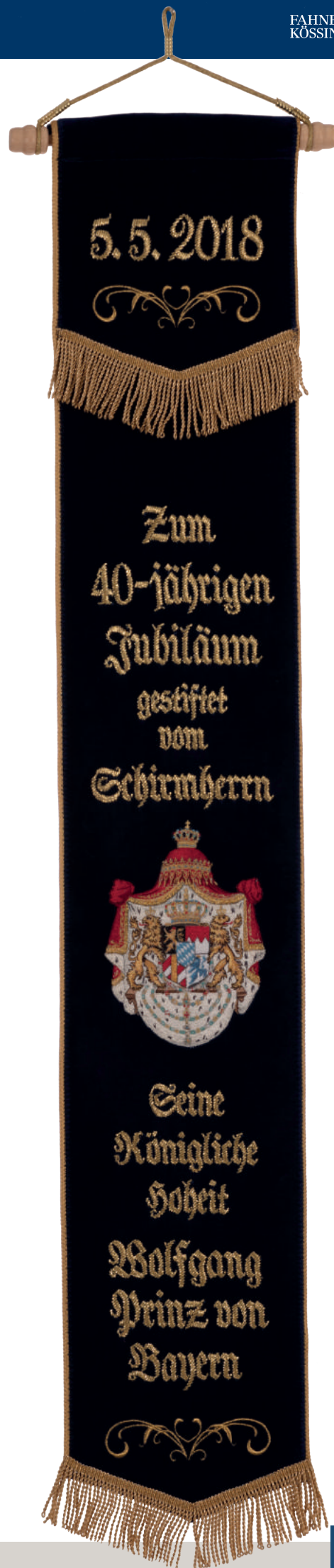
Gemaltes Mittelbild (siehe S. 46)