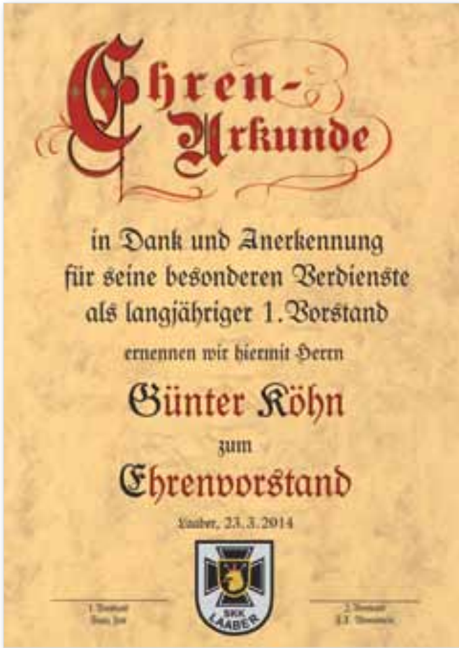
Sonderdruck 30 x 42 cm

Mit über 300 verschiedenen, künstlerisch gestalteten Urkunden bieten wir Ihnen eine unübertroffene Auswahl in allen Preislagen. Zu unseren Urkunden liefern wir Rahmen mit Golddekor und geprägte Urkundenmappen. Fragen Sie uns!