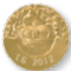
Art.-Nr. 430 138 Nr. 47