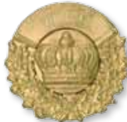
Art.-Nr. 430 132 Nr. 45