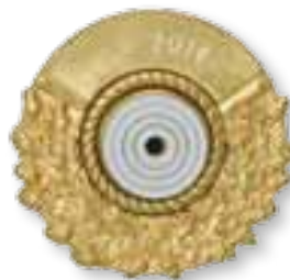
Art.-Nr. 430 135 Nr. 46