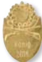
Art.-Nr. 430 078 Nr. 27