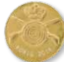
Art.-Nr. 430 066 Nr. 23