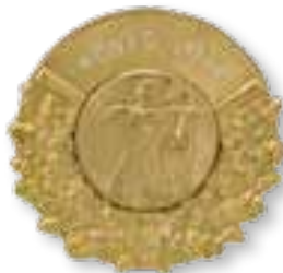
Art.-Nr. 430 126 Nr. 43