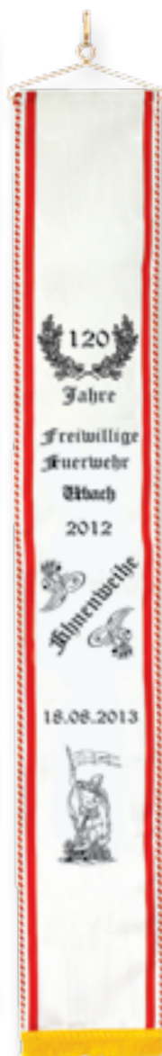
300 060 Rro