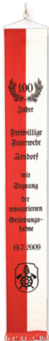
300 050 rwe