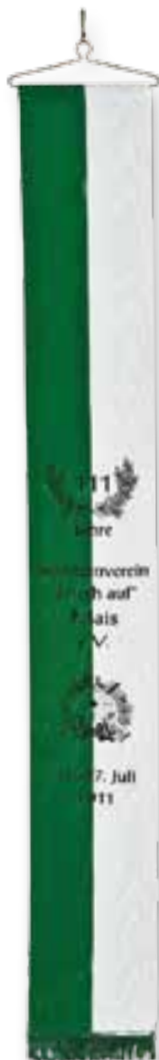
300 050 grw

Kostenlose Eindruck-Motive siehe Katalog-Rückseite (Seite 108)