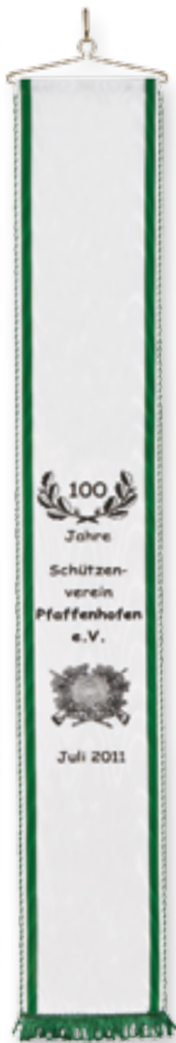
300 060 Rgr