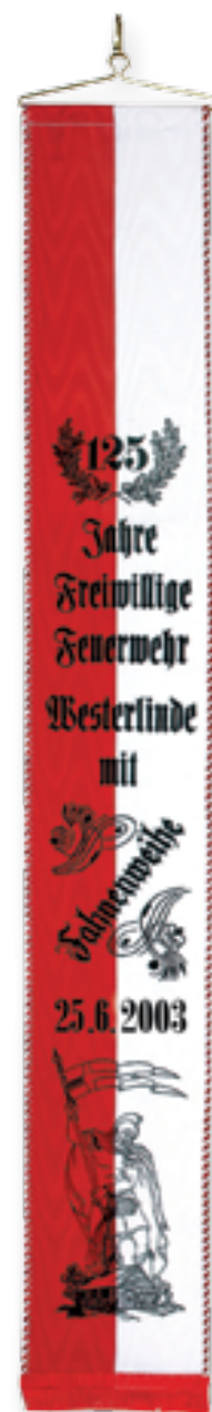
300 060 nwe