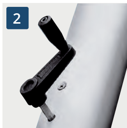
2 Abnehmbare Kurbel

Abnehmbare Kurbel: Hissen der Fahne mittels einer abnehmbaren Kurbel über den innenliegenden Seilzug mit Spezialseil.