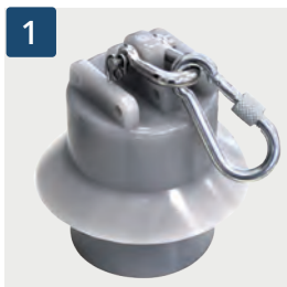
1 Kletterstoppgewicht (schallgedämpft)