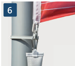
6 Fahnenhaken-Set bestehend aus einem Fahnenstrafferband und 3 Fahnenhaken