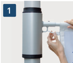
1 Drehbarer Ausleger