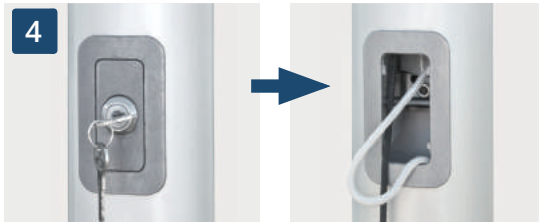
4 Abschließbares Türchen