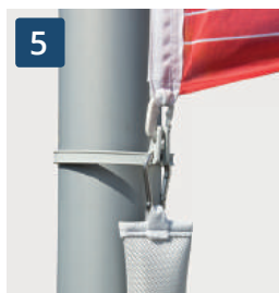
5 Fahnenstrafferband bestehend aus einem Fahnenstrafferband und 4 Fahnenstrahlschlingen