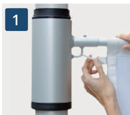
1 Drehbarer Ausleger