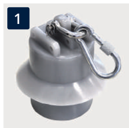
1 Kletterstoppgewicht (schallgedämpft)