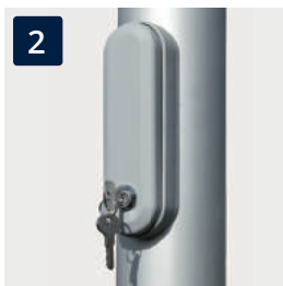
2 Zugriff zum innenliegenden Seilzug, abschließbar über Zylinderschloss