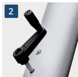
2 Abnehmbare Kurbel

Abnehmbare Kurbel: Hissen der Fahne mittels einer abnehmbaren Kurbel über den innenliegenden Seilzug mit Spezialseil.