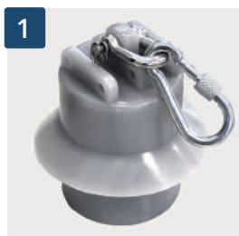
1 Kletterstoppgewicht (schallgedämpft)