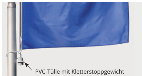
PVC-Tülle mit Kletterstopgewicht