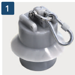
1 Kletterstoppgewicht (schallgedämpft)