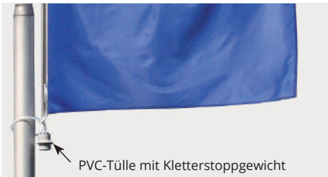
PVC-Tülle mit Kletterstopgewicht