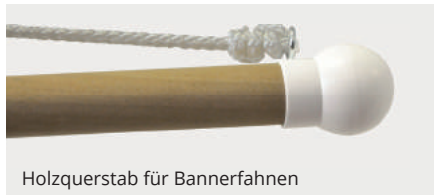
Holzquerstab für Bannerfahnen